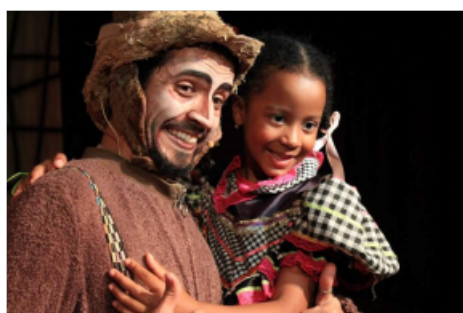
O espetáculo Os Saltimbancos encantou as crianças na abertura do Circuito Cultural, em Contagem.

“Contagem é um município com a presença de duas empresas do grupo ArcelorMittal, que já promovem diversas ações artísticas na cidade. Com o Circuito Cultural, a agenda se estrutura, ganha fôlego e foga, especialmente, o público infante-juvenil”, observa Leonardo Gloor, Diretor Superintendente da Fundação ArcelorMittal.